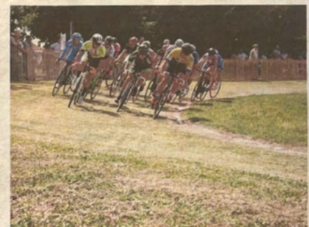
Lors du gala 2018, sur le vélodrome en herbe de Champagnolles.

La 97 e édition du Gala cycliste sur herbe a lieu samedi, au sud de Gémozac. L'équipement est unique en Europe