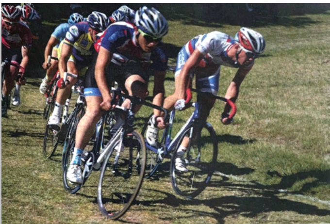
Hommes et femmes rouleront sur la piste en herbe du vélodrome des Acacias.