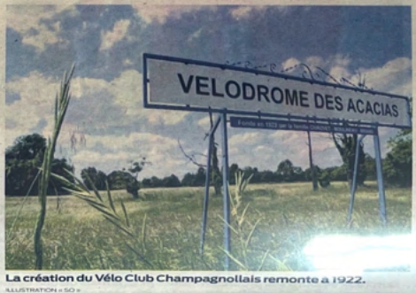
La création du Vélo Club Champagnollais remonte à 1922.

En 1938, avec son ami Henri Drouet, tout aussi passionné de cyclisme, ils ont l'idée de créer un vélodrome avec virages relevés. « Les paysans venaient avec des tombereaux pour relever les virages », rappelle Alain Lagarde. En 1939, le champion Paul Maye l'inaugure avec une épreuve sur piste, puis la guerre interrompt les courses.